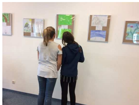
Zwei Büchereibesucherinnen studieren in Freital die ausgestellten Beiträge aus dem Mal- und Zeichenwettbewerb