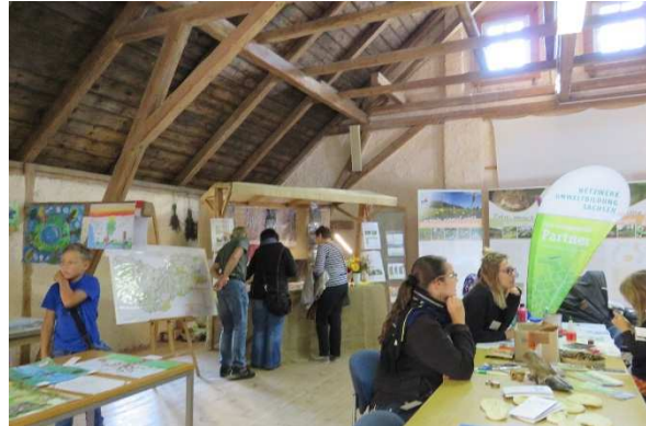
Blick auf den Stand des Projektes Natura 2000 Mit Ausstellung Malwettbewerb und Aktionsbasteltisch