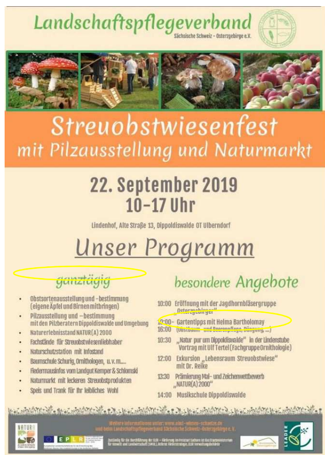
Plakat zum Streuobstwiesensfest mit Erwähnung Naturerlebnisstand und Prämierung Mal- und Zeichenwettbewerb