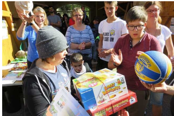
Glückliche Gesichter bei den Gewinnern des Mal- und Zeichenwettbewerbes