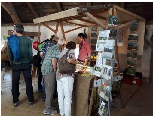
Naturerlebnisstand auf der Kulturscheune , viele Fragen und passende Antworten