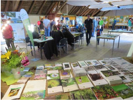
Blick vom Stand des Projektes Natura 2000 zum Aktionsbasteltisch