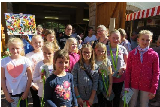
Ein tolles Filz-Bild schufen diese Kinder im Ganztagsangebot ihrer Grundschule